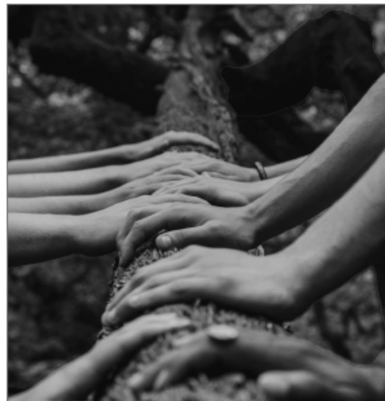
Foto 1: Wat heeft het voor zin als 'ik' mijn best doe als de rest niet meehelpt? Ben ik helemaal alleen in deze strijd? Deze foto associeer ik met dat vraagstuk. Het antwoord dat deze foto op deze twijfel voor mij geeft is: Nee, samen staan we sterk.