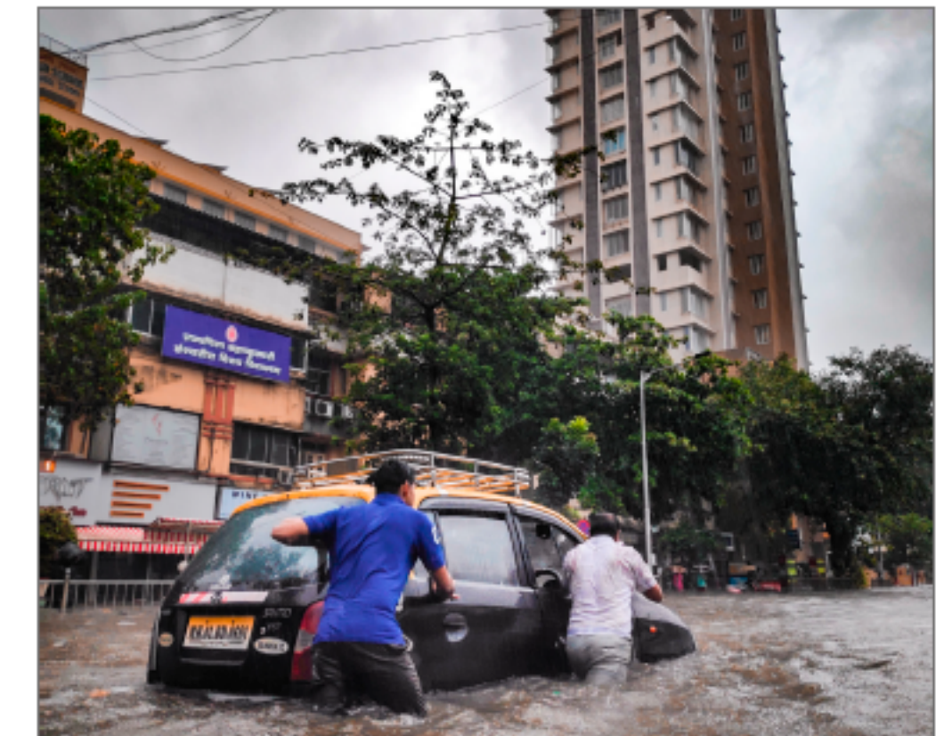
Foto 5: Twee mannen duwen auto door overstromde straten. Het artikel gaat over klimaat verandering en het effect dat dit heeft op de jongeren die deze wereld nog moeten bewonen. Deze foto geeft in een oogopslag weer wat de gevolgen zijn van de rommel die ze moeten opruimen. Visueel is het ook een wat grauw beeld door de grijze lichten. dit associeer ik met slecht nieuws & negativiteit