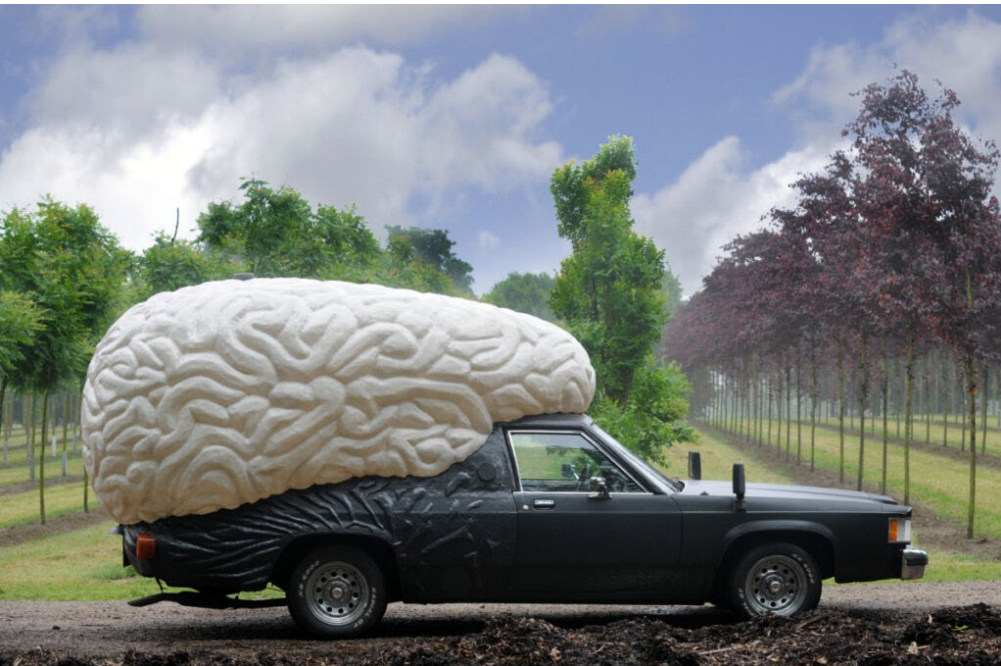
Brain Car, Olaf Mooij, 2009

De “hersenen” van de auto “dromen” en laten in het donker eigen beelden zien die gebaseerd zijn op de beelden van die dag.