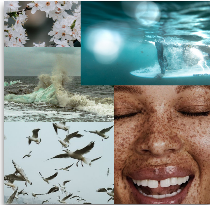
Gelukkig, vrij, rust