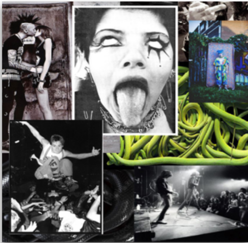
Brutaal, buiten de lijntjes, rauw